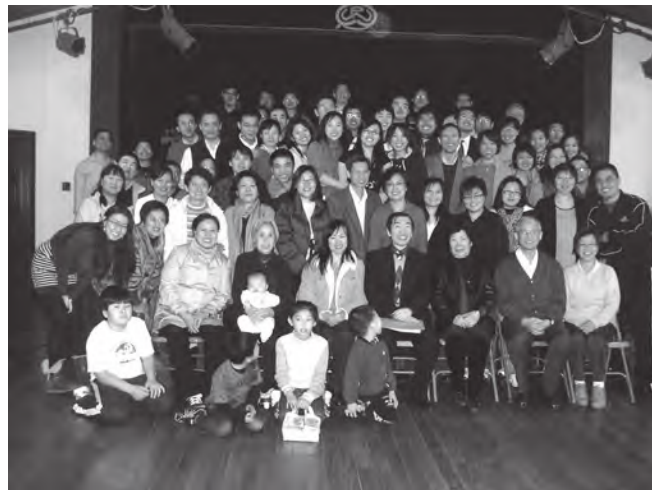
普度大學校園福音事工

我們盡可能地動員資源和人力來參與校園事工。除了在資金上提供充足的供應外，我們在同工的搭配上，也確保有足夠的同工投入在校園事工之中。在我們現有的8位執事同工中，有5位的主要精力是放在校園事工上。此外，我們還針對校園事工中人員流動性大的這個特點，特別為每一個學生團契小組配備一到兩個家庭。這些家庭同工都是對學生事工有負擔，並信主多年的成熟的同工。他們在學生工作上，起到了十分重要的作用。他們是小組的輔導員、教練，扶持並訓練學生同工。如果同工有生命和事奉上的問題，可以及時與他們溝通禱告。他們時常開放家庭接待學生，舉辦特別活動和小組禱告會，為離家在外的遊子們提供了一個「家」。