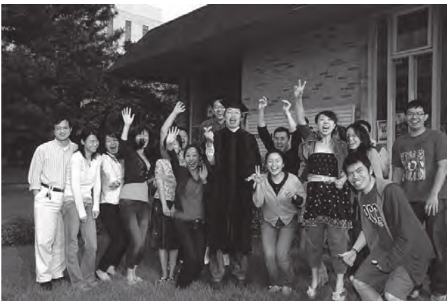
普度大學校園福音事工

1. 自稱QQ族群（這個族群大約有2.5-3億人，從某種意義上說，不知道QQ就不了解他們）。他們追求個性化，