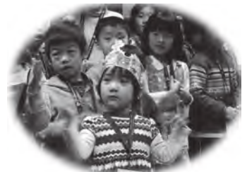
兒童節目-歡喜敬拜/專心聆聽