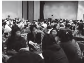
中文成人聚會-小組分享